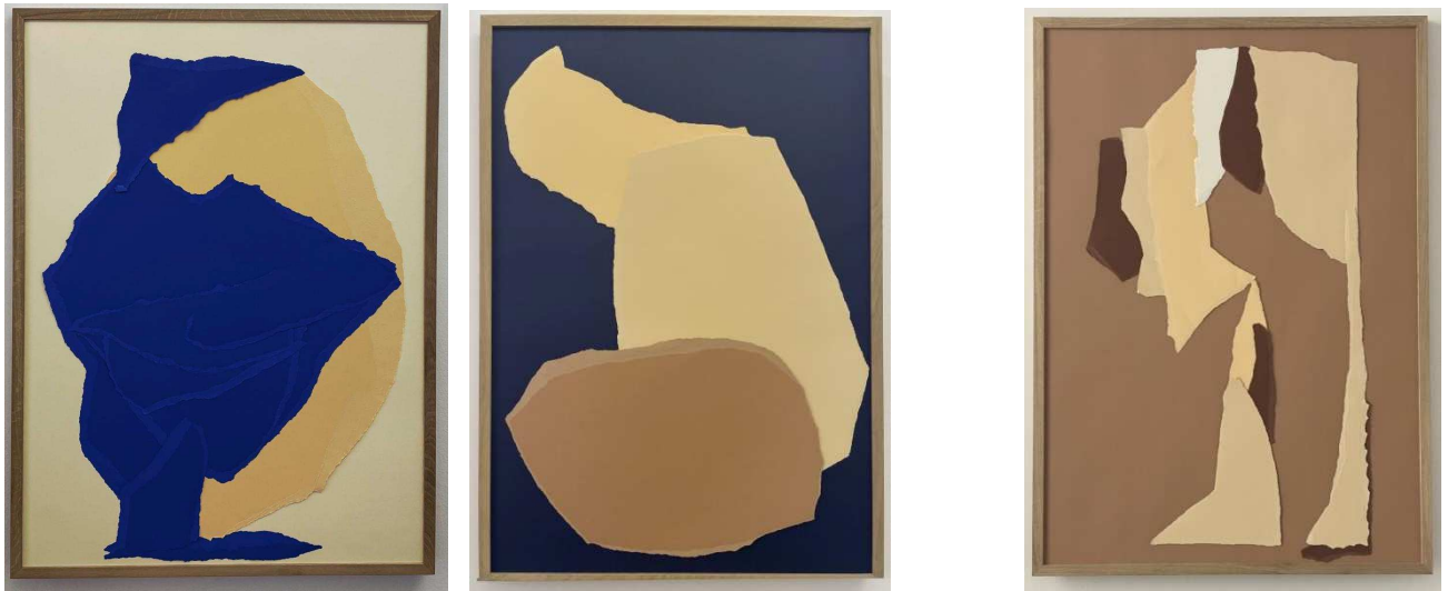
Serie: La symphonie des éclairs

In La symphonie des éclairs untersucht Marie-France Goerens das Fragment als formbildende und konzeptuelle Kraft. Jede Arbeit entsteht aus einer performativen Geste – Reißen, Falten, Brechen oder Schneiden –, durch die Fläche räumlich gedacht wird. Der Bildträger wird nicht komponiert, sondern konstruiert. Das Fragment steht dabei nicht für Verlust, sondern für Freiheit: Es erzeugt neue Ordnungen, Rhythmen und Wahrnehmungsräume. Überlagerte Papierschichten in tiefen Blau- und Erdtönen schaffen Spannungen zwischen Präsenz und Leere, Oberfläche und Tiefe. Kanten stoßen aufeinander, verdecken und öffnen sich – der Raum entsteht aus Reibung. Stets liegt den Collagen ein bildhauerischer Gedanke zugrunde: Formen werden gesetzt, verschoben, geschichtet wie Volumen im Raum. Die Fläche verhält sich wie ein Relief, wie eine verdichtete Skulptur. In der Tradition von Kurt Schwitters wird das Fragment nicht als Rest, sondern als konstruktives Material einer selbstbestimmten, improvisierten Ordnung verstanden. (MFG)