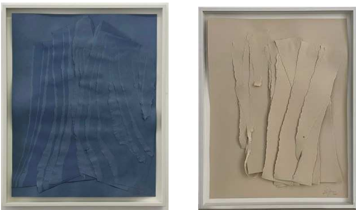
Serie: Petite déchirure bleue, sauge, champagne, taupe

In La symphonie des éclairs untersucht Marie-France Goerens das Fragment als formbildende und konzeptuelle Kraft. Jede Arbeit entsteht aus einer performativen Geste – Reißen, Falten, Brechen oder Schneiden –, durch die Fläche räumlich gedacht wird. Der Bildträger wird nicht komponiert, sondern konstruiert. Das Fragment steht dabei nicht für Verlust, sondern für Freiheit: Es erzeugt neue Ordnungen, Rhythmen und Wahrnehmungsräume. Überlagerte Papierschichten in tiefen Blau- und Erdtönen schaffen Spannungen zwischen Präsenz und Leere, Oberfläche und Tiefe. Kanten stoßen aufeinander, verdecken und öffnen sich – der Raum entsteht aus Reibung. Stets liegt den Collagen ein bildhauerischer Gedanke zugrunde: Formen werden gesetzt, verschoben, geschichtet wie Volumen im Raum. Die Fläche verhält sich wie ein Relief, wie eine verdichtete Skulptur. In der Tradition von Kurt Schwitters wird das Fragment nicht als Rest, sondern als konstruktives Material einer selbstbestimmten, improvisierten Ordnung verstanden. (MFG)