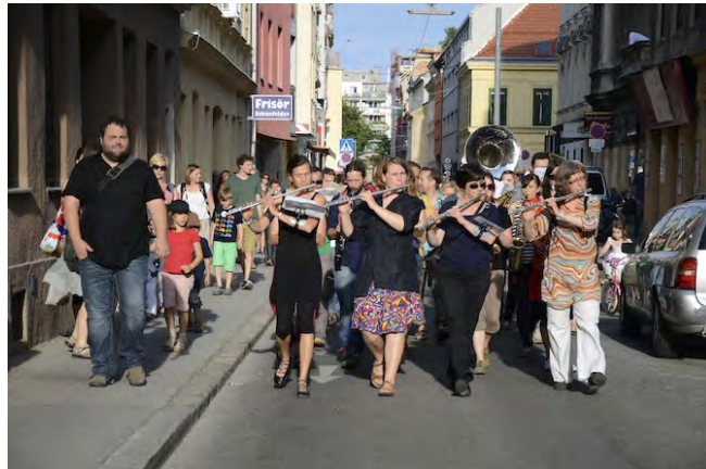
Grundstein Eröffnung 2013 mit der MusikaarbeiterInnenkapelle

Das Viertel ist auch bedeutend für die Geschichte der österreichischen ArbeiterInnenbewegung.