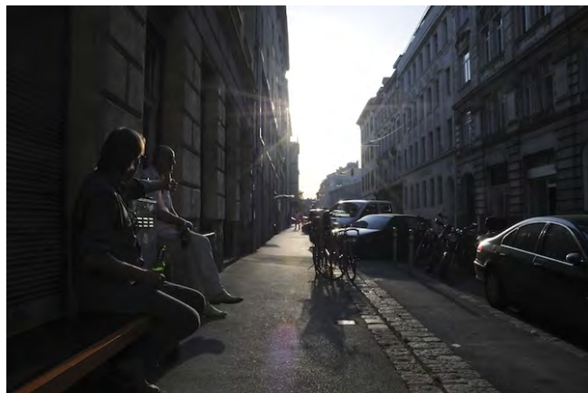
Grundsteingasse Sonnenuntergang

Die Grundsteingasse selbst ist eine schmale Gasse, die den Brunnenmarkt kreuzt und am Wiener Gürtel endet (eine 4spurige, kreisförmig angelegte “Stadtautobahn”, die den früheren Linienwall zur inneren Stadt abbildet). Blickt man vom Gürtel stadtauswärts sieht man auf die sogenannten “Wiener Hausberge” mit dem Wienerwald. Im Sommer geht die Sonne genau auf der Linie mit der Grundsteingasse unter.