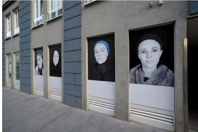
The Person I could be“ von Martina Gasser

Während des Grundsteinfestivals im Juni und September sperren alle Räume zeitgleich auf und präsentieren ihre Ausstellungen und Projekte. Verbindendes Element sind Performances, Lesungen und kleine Konzerte, sowie Interaktionen im öffentlichen Raum der Grundsteingasse.